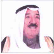
صاحب السمو الشيخ صباح الأحمد الجابر الصباح أمير دولة الكويت