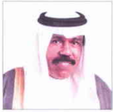
سمو الشيخ نواف الأحمد الجابر الصباح ولي عهد دولة الكويت